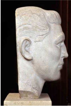
Louis Van Cutsem – Bokser Emile Delmine