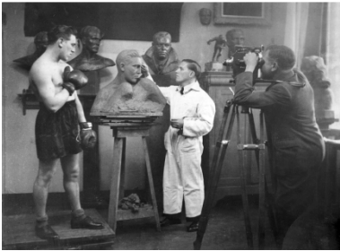
Louis Van Cutsem met bokser Kid Dussart, 1947