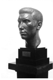
Louis Van Cutsem – Eddy Merckx © Atelier Louis Van Cutsem