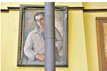
Binnenzicht van het atelier