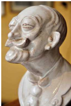
Louis Van Cutsem – Adolphe Max