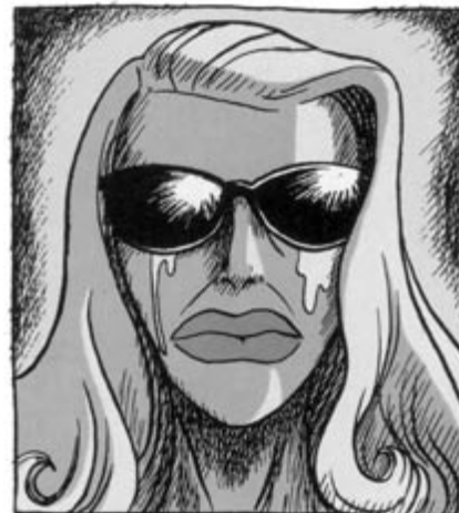
Lijf om lijf