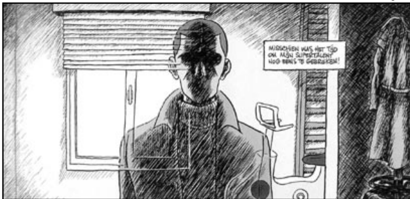
Lijf om lijf

„Die stijl is het resultaat van zeg maar ‘al het voorgaande’. Eerst heb ik vier jaar in Doornik aan de Academie voor Schone Kunsten gestudeerd, waar ik als jongeman een hele verscheidenheid aan stijlen ontdekte. Ik geef toe dat ik als jongere een eerder klassieke leesvoorkeur had, met Kuifje , Asterix en Lucky Luke als voornaamste helden. Maar in Doornik ging er een heel nieuwe