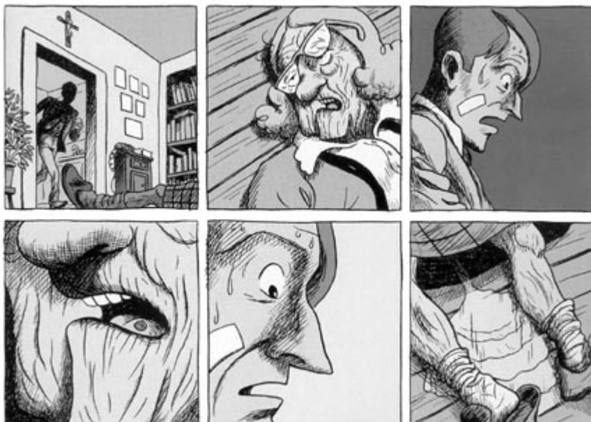
Lijf om lijf

maar tegelijkertijd ook heel erotisch en spannend werk afleveren. En natuurlijk Fellini, ik vind mijn verhalen – en vooral de vrouwen erin – erg felliniaans. (lacht) Neem Bérénice: voluptueus, maar geen oppervlakkig karakter.”