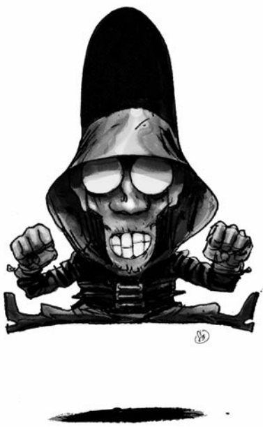
Ongepubliceerde ode aan Moebius

ben als twaalfjarige Latijn gaan studeren, omdat ik dacht op die manier strips te kunnen maken à la Asterix. (glimlacht) We lazten thuis alles van Dupuis, we hadden alle Kuifjes... Eigenlijk alles met prentjes wat voorbij kwam. Zo hadden we een abonnement op Donald Duck, Eppo, Tina, Kuifje én op Robbedoes. We begonnen met de goede strips. En na een halve week, als de leeshonger wat gestild was, gingen we verder met Oom Wim en dat soort dingen. Als puber gebeurde er heel veel dingen op heel veel gebieden die mijn leven beïnvloed hebben. Ten eerste veranderde het stripverhaal zélf: je kreeg auteurs als Moebius en Bilal, met de generatie tekenaars van het fantastische tijdschrift Métal Hurlant. Tegelijkertijd leerde ik de punk kennen. Lokaal, bij ons in Turnhout, was er opeens een heel interessante punk-scene die onder meer gigs in kelders organiseerde en zo. Als veertienjarige inspireerde me dat enorm, onder andere tot het maken van Embryo. Ik leerde van de punkbeweging dat je om dingen te veranderen zelf de handen uit de mouwen moest steken. Sturm und Drang. Er ging een enorme dynamiek van uit."