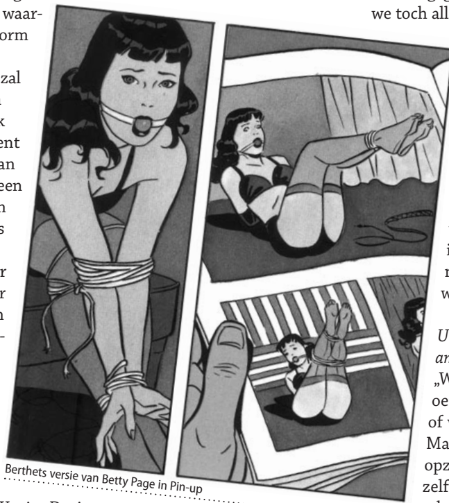
Berthets versie van Betty Page in Pin-up

Maar het album zal nog even op zich laten wachten. Ik ben op dit moment namelijk bezig aan een album voor een spin-off serie van de bekende reeks XIII . Het is de bedoeling om per album iets dieper in te gaan op één van de nevenpersonages uit de reeks. Zo richt het eerste deel – dat dit najaar verschijnt en gemaakt wordt door