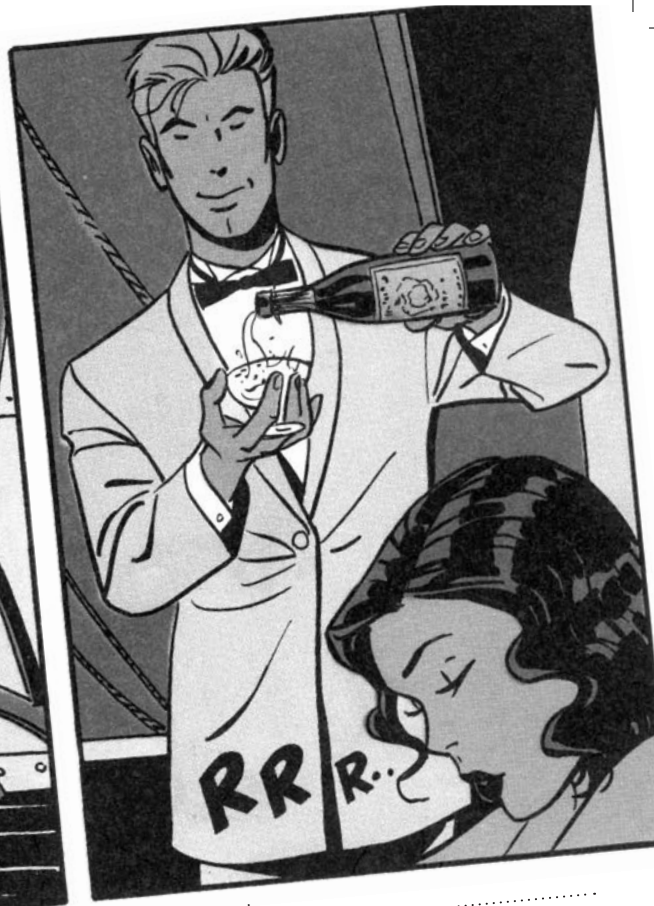
De P.I. van Hollywood